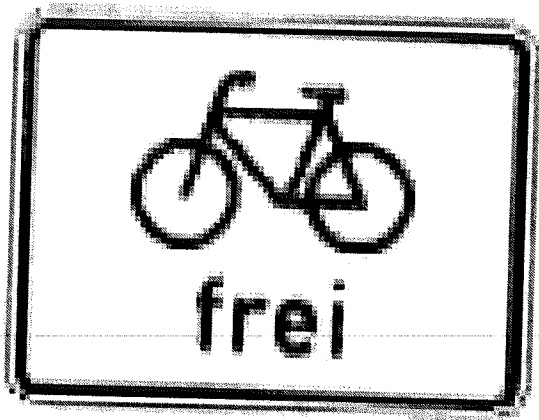
Zeichen 1022-10 Radverkehr frei

Das bedeutet, dass das Zeichen Radverkehr frei auch anzeigt: Gilt nicht für Radfahrer.