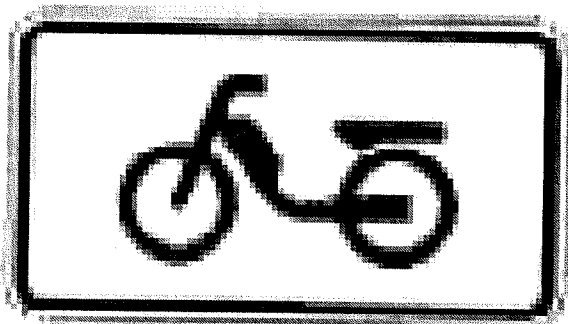
Zeichen 1046-11 Nur Mofas

Die StVO sieht vor, dass Verkehrszeichen u. a. nur für bestimmte Fahrzeugarten gelten oder nicht gelten sollen. Das kann durch Zusatzzeichen zu den Verkehrszeichen angeordnet werden. Dazu folgendes Beispiel: