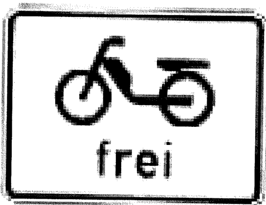
Zeichen 1022-11 Mofas frei

Bedeutung: Das damit in Verbindung angebrachte Verkehrszeichen gilt nur für Mofas.