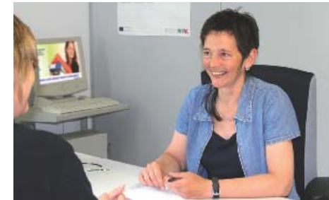
Koordinierungsstelle Frau und Beruf Kreis Unna